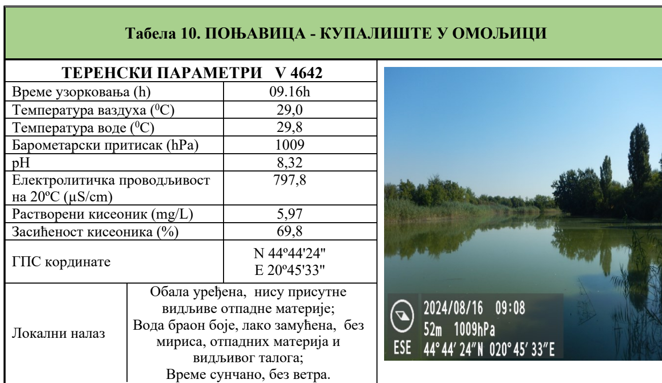
Табела 10-11. Извештаји о извршеном хигијенском надзору и резултати мерења на терену