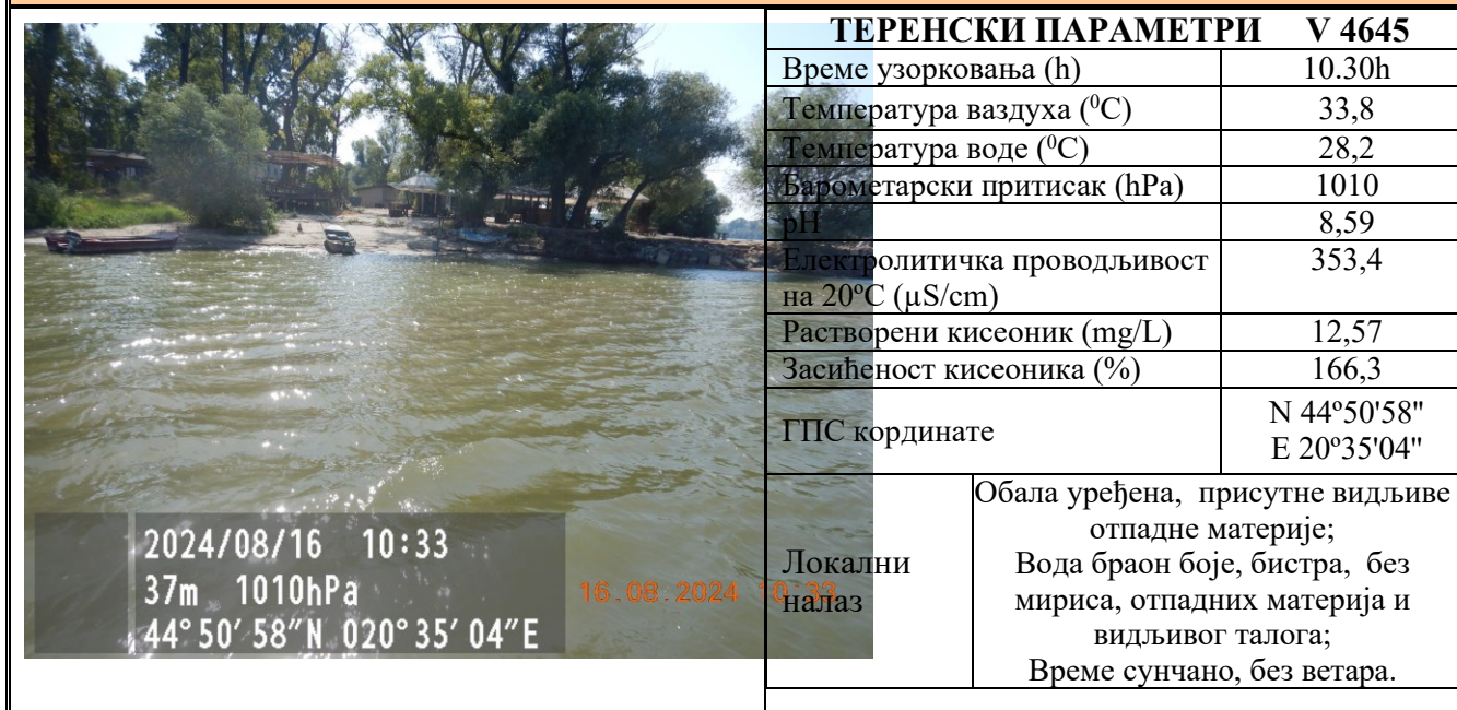
Табела 8. РЕКА ДУНАВ - КУПАЛИШТЕ БЕЛА СТЕНА ДЕСНО ОД ШПИЦА