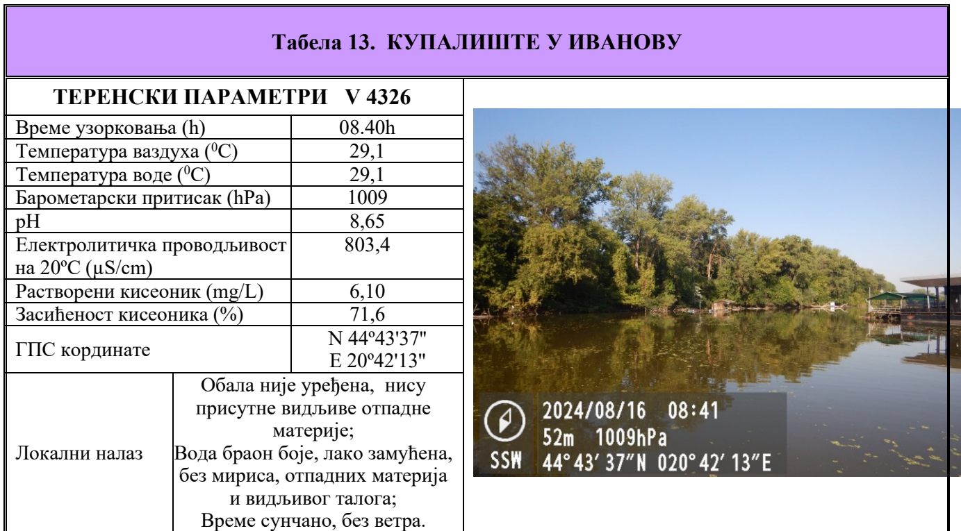
Табела 13. Извештаји о извршеном хигијенском надзору и резултати мерења на терену