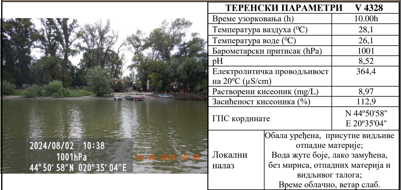
Табела 8. РЕКА ДУНАВ - КУПАЛИШТЕ БЕЛА СТЕНА ДЕСНО ОД ШПИЦА