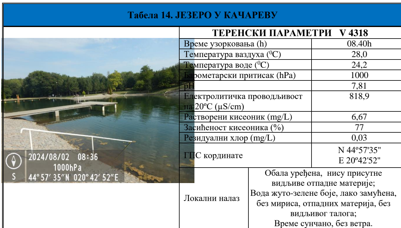
Табела 15. Извештаји о извршеном хигијенском надзору и резултати мерења на терену