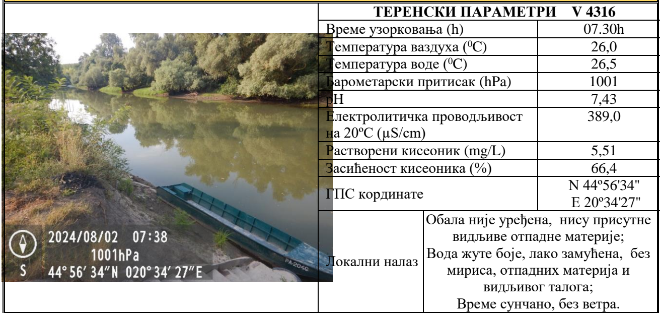
Табела 5. РЕКА ТАМИШ - КУПАЛИШТЕ У ГЛОГОЊУ