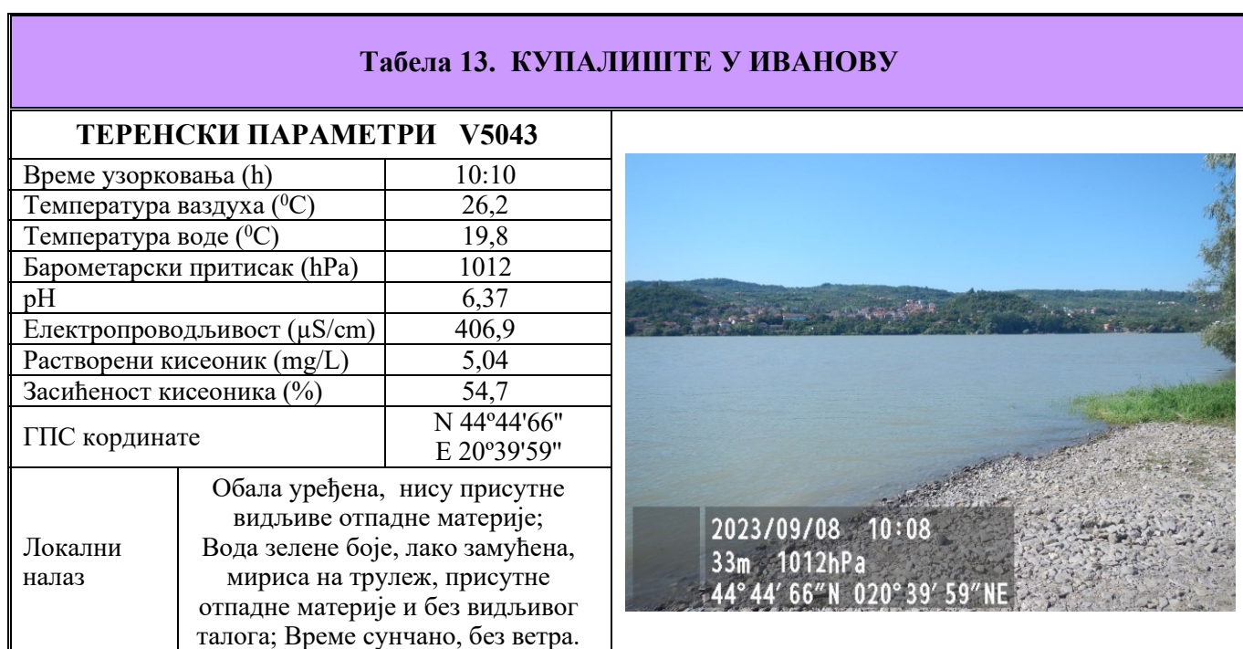
Табела 13. Извештаји о извршеном хигијенском надзору и резултати мерења на терену